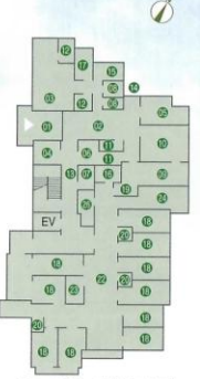
ユニット館 1階 平面図