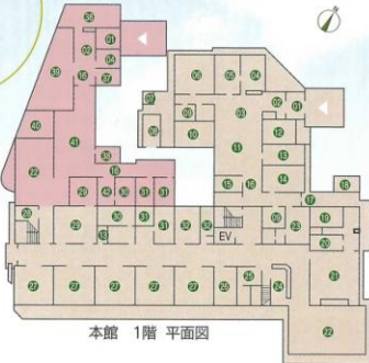
本館 1階 平面図